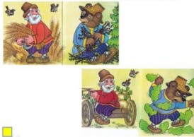
«Что сначала, что потом?»

На слайде представлены картинки из сказки «Вершки и корешки». Детям предлагается рассказать, что сначала посадил мужик, а что потом. По щелчку мыши появляется нумерация картинок, для самооценки детей.