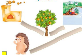
«Как спасала сестрица своего братца?»

На слайде представлена схема пути сестрицы Алёнушки. Детям предлагается вспомнить, что или кто помогал спасти братца. По щелчку мыши