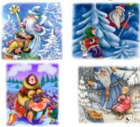
«Расставь по порядку»

На слайде представлены картинки из сказки «Морозко». Детям рассказывают отрывки из сказки и расставляют картинки по порядку. По щелчку мыши картинки перемещаются по порядку сверху-вниз по сюжету сказки. Щелчок по квадрату – возврат на гиперссылку (слайд 3 Сказка «Морозко»)