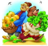
«Вершки и корешки»

На слайде представлена сюжетная картинка из сказки «Вершки и корешки». Щелчок по квадрату – гиперссылка на слайд 7. Щелчок по треугольнику – гиперссылка на интерактивный слайд 2.